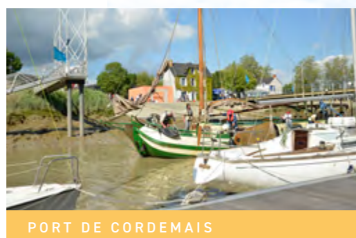
PORT DE CORDEMAIS

Les opportunités professionnelles sont au rendez-vous avec un territoire attractif. La communauté Estuaire-Sillon anime le tissu économique et accompagne de nombreuses entreprises qui souhaitent s'y installer.