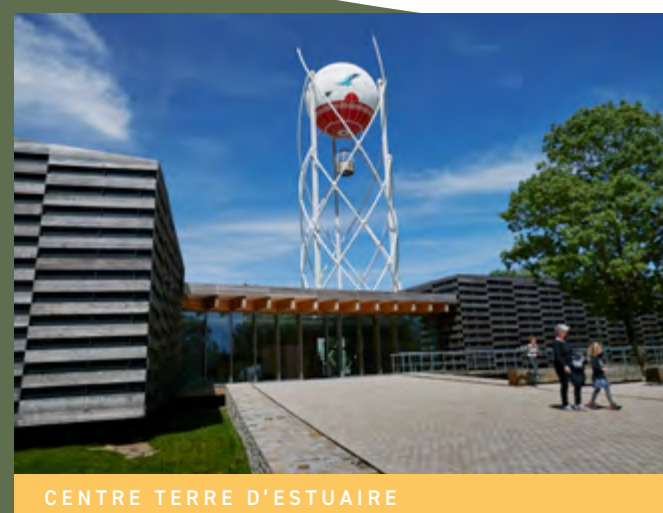
CENTRE TERRE D'ESTUAIRE

Le quotidien de votre famille sera animé par les nombreuses manifestations locales organisées sur le territoire tout au long de l'année comme les animations culturelles, sportives (avec notamment l'hippodrome et le centre aquatique Aquamaris) ou encore le centre Terre d'Estuaire... Plusieurs structures scolaires accueillent vos enfants de la maternelle au collège.