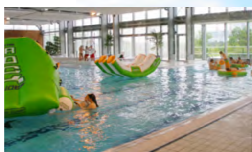
CENTRE AQUATIQUE AQUAMARIS