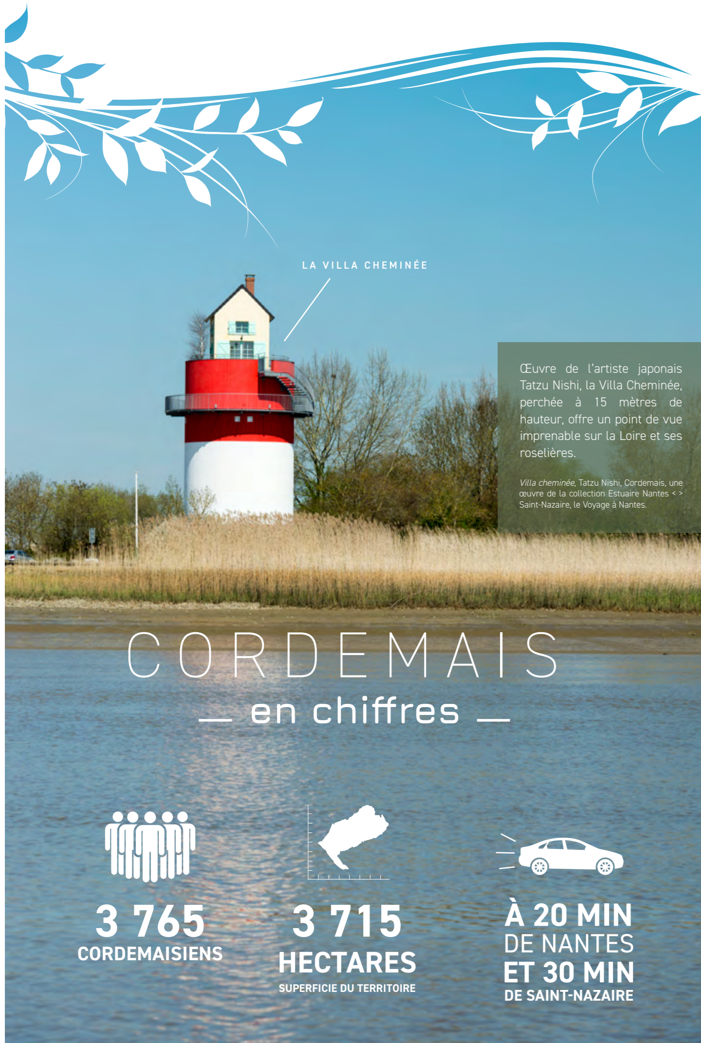
LA VILLA CHEMINÉE

Œuvre de l'artiste japonais Tatzu Nishi, la Villa Cheminée, perchée à 15 mètres de hauteur, offre un point de vue imprenable sur la Loire et ses roselières.