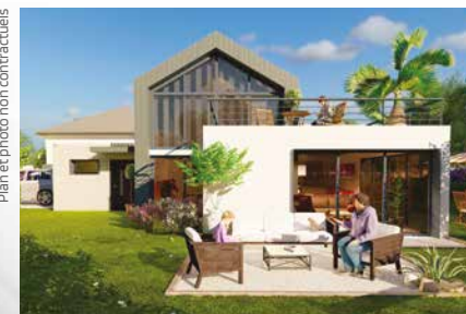
EXEMPLE DE PROJET ATTENDU SUR CE PROGRAMME

Un projet composé de seulement 9 terrains prêts à bâtir. À l'abri des regards, vivez dans un [ HAMEAU PRÉSERVÉ ] intégré à son cadre naturel. Profitez d'une atmosphère paisible et végétale où la nature garde ses droits.